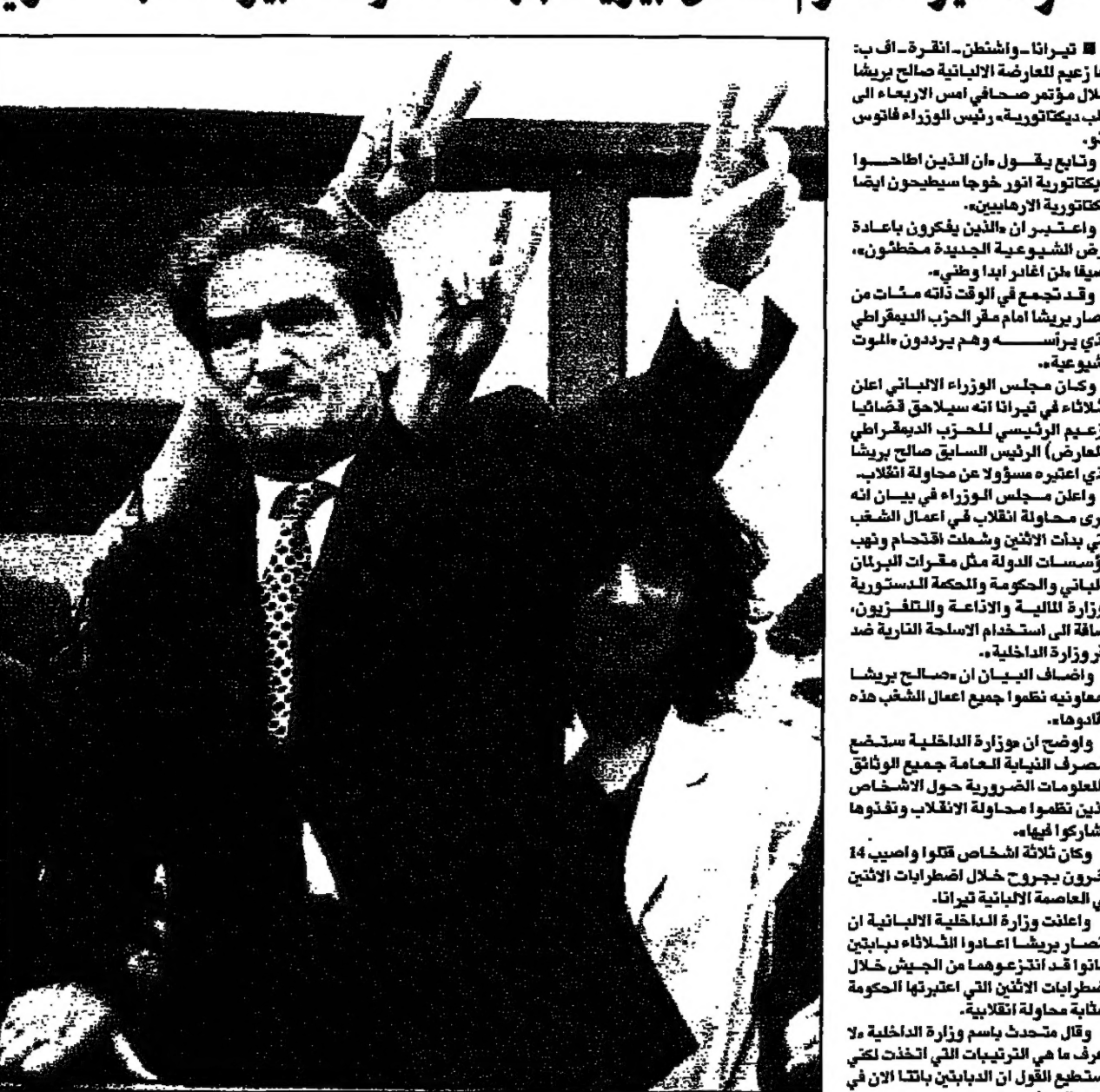
زعيم المعارضة الاملائي صالح بيريشا يحيى مؤيديه من شرفة مقر حزبه أثناء مظاهرة مناهضة للحكومة في تيرانا

العسكرية التي استولوا عليها خلال اضطرابات الاثين. واوضح ان الحكومة الامريكية مستعدة لتقديم المساعدة اذا اقتضى الامر، الى المواطنين الامريكين الذين يعيشون في البانيا، لكن الامريكيين الذين هم في كوسوفو في كيرانا) او عسكريين حلف شمال الاطلسي لم يتلقوا تعريضا حتى الان.